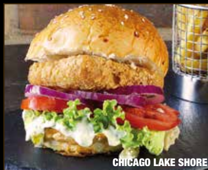
CHICAGO LAKE SHORE