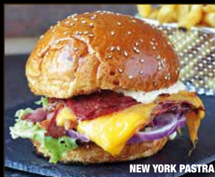
NEW YORK PASTRA