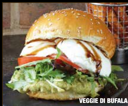
VEGGIE DI BUFALA